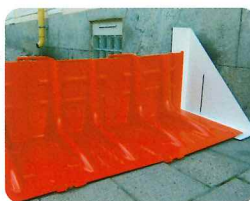
▲サイドアタッチメント