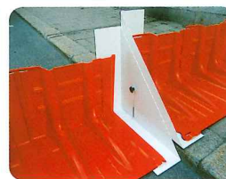
▲段差対応アタッチメント