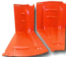
アウトコーナー(左) インコーナー(右) ▶