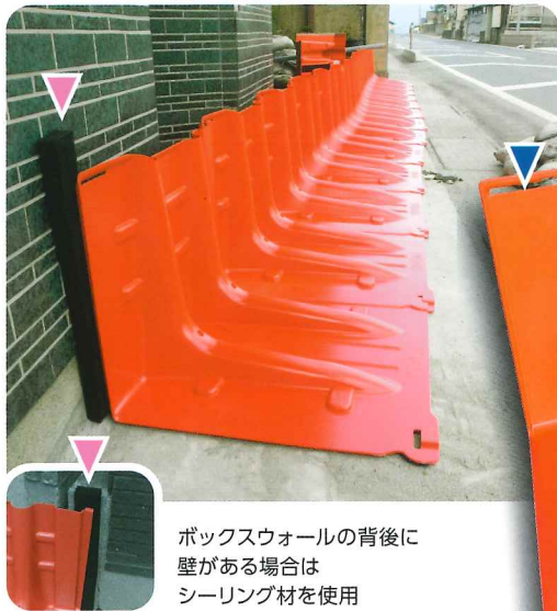
ボックスウォールの背後に壁がある場合はシーリング材を使用