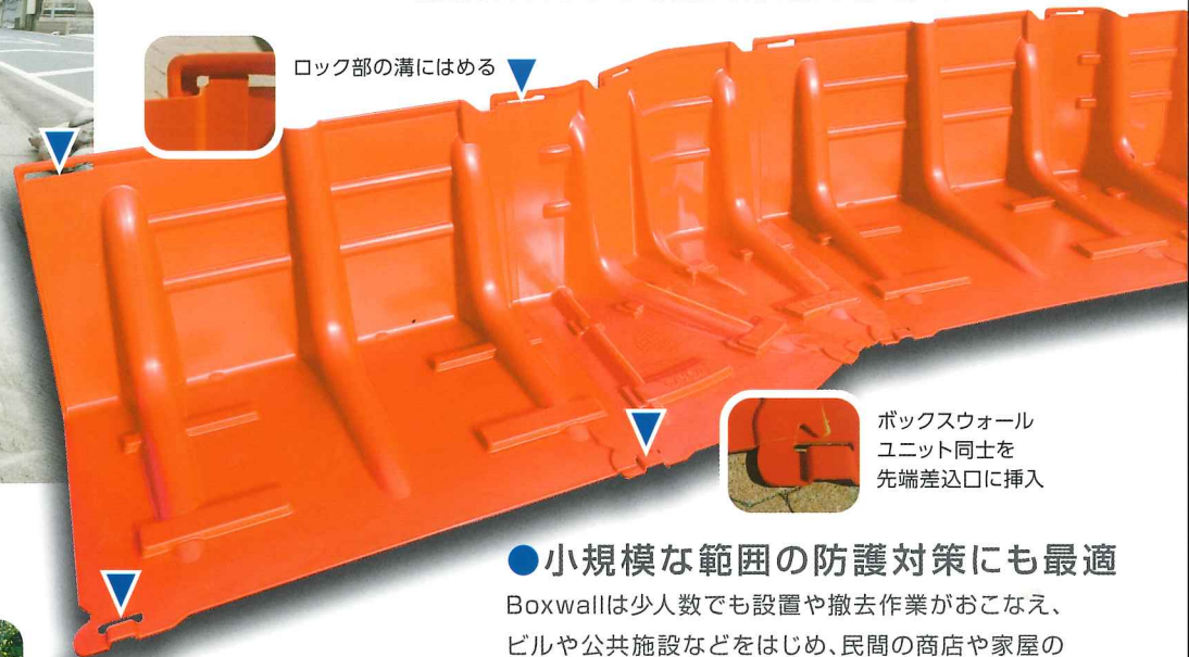
ロック部の溝にはめる ▼