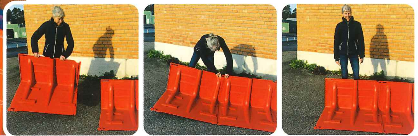
▲設置は、ボックスウォールを背後から見て左から右に並べる

Boxwallは特殊な工具やスキルを必要とせずに設置ができ、ユニットのジョイント部(▼印)をつなぐことができます。各ジョイント部は±3度の調節ができ、カーブした設置場所でも対応可能です。